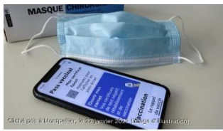
Mesures d'exception, contrôle aux frontières... : le Parlement vote définitivement le texte sanitaire 26 juillet 2022 à 18:47

Après un dernier vote au Sénat, le projet de loi sanitaire a finalement été adopté malgré un parcours pour le moins mouvementé. Il met fin dès le 1er août au passe sanitaire mais prévoit la possibilité d'un test obligatoire aux frontières.